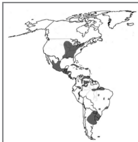
Foto 3 Distribución geográfica de Histoplasma capsulatum

La histoplasmosis afecta principalmente a Centroamérica, Sudamérica y Estados Unidos (foto 3), en este último país, 80% de la población que vive en las riveras de los ríos Ohio y Misisipi ha estado en contacto con H. capsulatum 2,14 y hasta 25% de las personas seropositivas a VIH en estas áreas, desarrollan enfermedad diseminada. 15 En Estados Unidos la histoplasmosis se considera una infección emergente en personas inmunodeficientes, ya que en estos pacientes las formas diseminadas y letales son comunes. Se le considera una enfermedad de tipo ocupacional, se encuentran en riesgo mineros, espeleólogos, guaneros, agricultores y trabajadores rurales de bajo nivel socioeconómico. Los ambientes muy cerrados como cuevas, grutas y construcciones abandonadas inducen morbilidad ocasional que puede generar casos severos, en cambio los espacios abiertos generan una alta morbilidad pero con una baja letalidad, estas últimas asociadas a pacientes inmunosuprimidos. La histoplasmosis es importante en los niños, debido a que en ellos es frecuente la forma diseminada de la enfermedad, por otra parte esta micosis se presenta más en hombres que en mujeres en una proporción de 4:1. 2,3,8